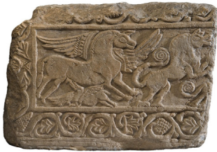
Flügelpferdrelief, Ende 8. Jahrhundert, Kaiserpfalz Ingelheim