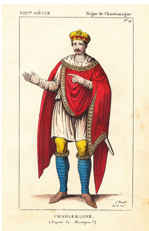
L. Massard, CHARLEMAGNE Kolorierte Radierung, 1838

3 Ausstellungen zum Karlsjahr 2014 in der Kaiserpfalz Ingelheim